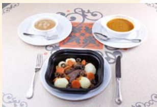
Voorbeeld van een maaltijd voor iemand met voedselallergie