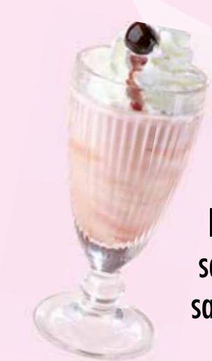
Milkshake Préparation à base de glace parfum vanille et accompagné de crème fouettée

DELUXE SHAKES ..... 12€ Inventez votre milkshake avec 1 ou 2 parfums de votre choix (fraise, café, sauce chocolat, banane, beurre de cacahuètes, biscuit cacao goût vanille, sauce Annette's caramel, Nutella® ou marron-vanille)