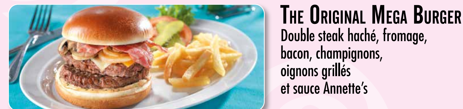
THE ORIGINAL MEGA BURGER Double steak haché, fromage, bacon, champignons, oignons grillés et sauce Annette's

THE FIFTY-FIFTY Steak haché, fromage Pepper Jack, aiguillettes de poulet panées, bacon, poivrons, sauce Annette's et coriandre